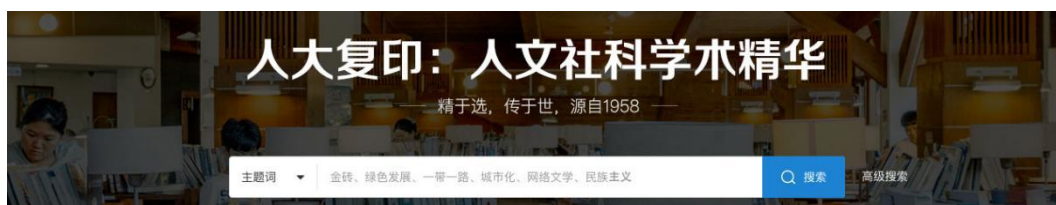
(首页一框式检索、高级检索入口)

平台为用户提供多种检索模式，用户可通过不同检索模式，根据自己的需求精准地查找到文献资源。检索模式包括：一框式检索、高级检索、导航式检索。